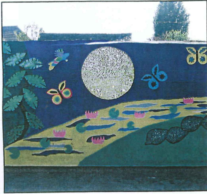
Fresques réalisées par les élèves